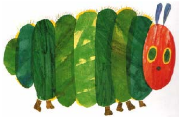
grote, dikke rups