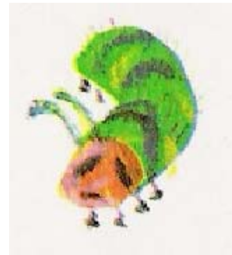
pijn in z'n buik